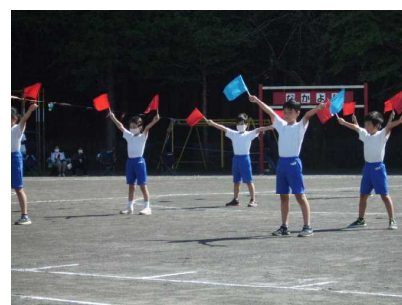
【あいうえおフラッグ】