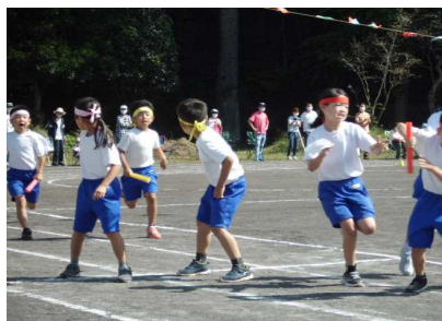
【バトンでつなげ 丹那ピック】